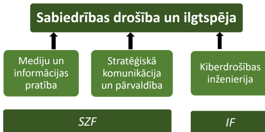
1.attēls. Sinerģija starp ViA studiju programmām no dažādām fakultātēm.

2016.gadā IKZ studiju virzienā uzsākta t.s. medijpratības iniciatīva, kuras ietvaros notiek gan esošā studiju satura pilnveidošana bakalaura līmenī, tikusi izveidota MIP programma, kā arī izstrādāts mūžizglītības piedāvājums pedagogiem, vidusskolēniem un citām auditorijām. Tiek īstenoti dažādi mediju satura dekonstrukcijas projekti, kā arī tiek publicēta mediju kritika. Informāciju par visām IKZ studiju virzienā veiktajām medijpratības aktivitātēm var atrast ViA mājas lapā: http://www.va.lv/lv/zinatne/mediju-pratibas-iniciativa . Iniciatīvas ietvaros IKZ virzienā izveidota stratēģiska partnerība un uzsākts darbs pie kopīgiem projektiem ar tādām pasaules klases universitātēm kā Karaļa Koledža Londonā, Tartu Universitāte Igaunijā un citām augstākās izglītības iestādēm, tai skaitā arī ārpus ES robežām, piemēram, Mohylas akadēmijas Žurnālistikas skolu Ukrainā, Tbilisi Valsts universitāti Gruzijā, Gruzijas publiskās pārvaldes institūtu (GIPA). Tik plašs tāda līmeņa sadarbības partneru loks nodrošina plašas sadarbības iespējas pētniecībā un akadēmiskajā darbā. Cieša sadarbība notiek ar NATO Stratēģiskās komunikācijas izcilības centru,